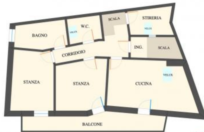
PIANTA PIANO TERZO SCALA A VISTA